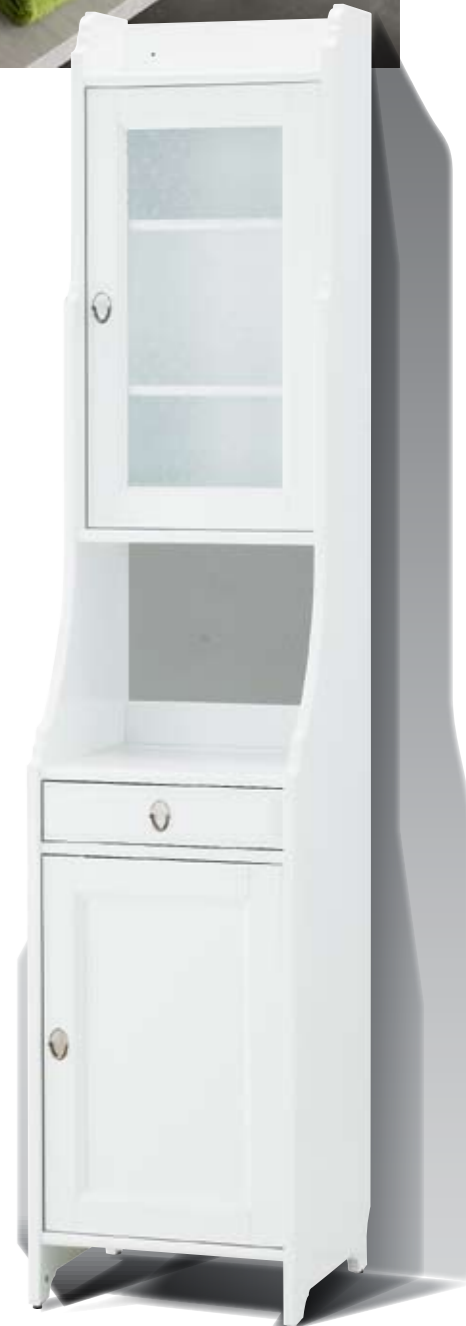
> ШКАФ «ФЛОРЭН» (ИКЕА) Каркас, фасады: ДСП, матовое лакокрасочное покрытие От 7 990 руб.

НА ВКУС И ЦВЕТ Найти цветную, а не белую мебель для ванной комнаты ещё пару лет назад было практически невозможно. Однако сейчас даже отечественные производители позволяют себе колористические эксперименты. Правда, белизна и нежные пастельные оттенки по-прежнему преобладают. Дело в том, что эти цвета универсальны. Большинство же из нас покупает мебель уже после завершения отделки. Кроме того, и белый, и голубой цвет ассоциируются с чистотой. И многим кажется, что в ванной комнате должна находиться именно такая, «чистая» мебель.