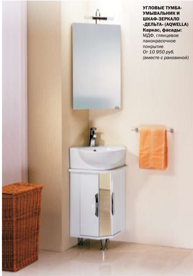
УГЛОВЫЕ ТУМБА-УМЫВАЛЬНИК И ШКАФ-ЗЕРКАЛО «ДЕЛЬТА» (AQWELLA) Каркас, фасады: МДФ, глянцево-лакокрасочное покрытие От 10 950 руб. (вместе с раковиной)