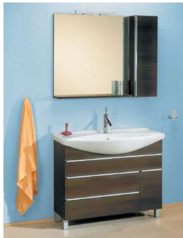
◀ ТУМБА-УМЫВАЛЬНИК И ШКАФ-ЗЕРКАЛО ИЗ СЕРИИ «АРИЗОНА» (AQWELLA) Каркас, фасады: ДСП, искусственный шпон От 22 800 руб. (вместе с раковиной)