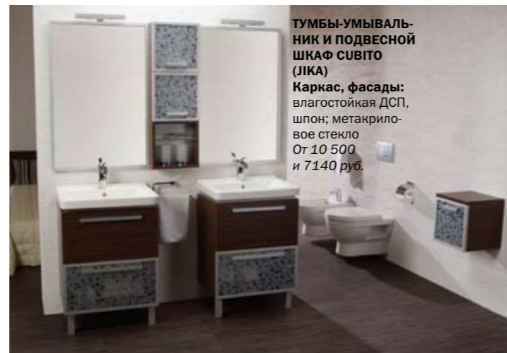
ТУМБЫ-УМЫВАЛЬНИК И ПОДВЕСНОЙ ШКАФ СУВИТО (JICA) Каркас, фасады: влагостойкая ДСП, шпон; метакриловое стекло От 10 500 и 7140 руб.

Для начала стоит разобраться с материалами, из которых изготавливают мебель для ванных комнат. Это дерево, стекло, металл, а также влагостойкие ДСП и МДФ, причём наибольшей популярностью у производителей пользуются два последних материала. Поясним причины. Ванная комната – не-