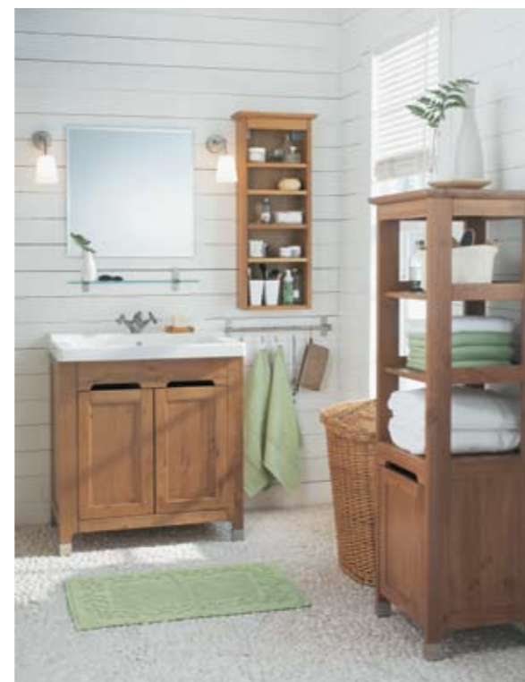
▶ ПРЕДМЕТЫ ИЗ СЕРИИ «ФРЕДЕН» (IKEA) Каркас, фасады: массив сосны, морилка, лак От 16 600 руб. (за комбинацию на фото)

жена своя раковина. Именно поэтому покупка составляющих по отдельности лишена всякого смысла. Вероятность того, что они друг другу не подойдут, стопроцентная. Переделывать же заводскую продукцию, к тому же предназначенную для эксплуатации в помещении с повышенной влажностью, – занятие неблагоприятное. Ведь чем лучше защищены от воды места стыковки шкафа с раковиной, тем продолжительнее срок службы всего предмета. Если же интерес к определённой раковине превалирует, лучше вообще отказаться от приобретения «мойдодыра». Для хранения многочисленных флаконов и баночек подойдут также подвесной шкафчик с зеркалом и шкаф-колонка.