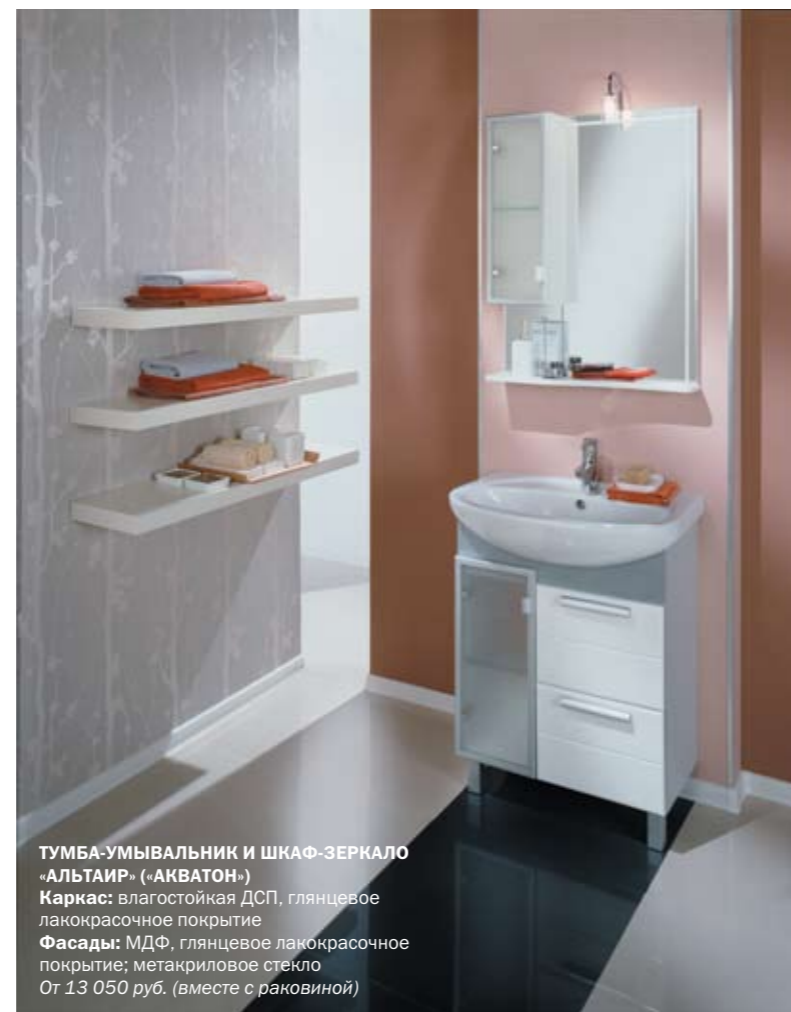
ТУМБА-УМЫВАЛЬНИК И ШКАФ-ЗЕРКАЛО «АЛЬТАИР» («АКВАТОН») Каркас: влагостойкая ДСП, гляцевое лакокрасочное покрытие Фасады: МДФ, гляцевое лакокрасочное покрытие; метакриловое стекло От 13 050 руб. (вместе с раковиной)

В принципе, вышеупомянутые предметы мебелировки ванных комнат обычно входят в мебельную программу вместе с «мойдодыром». Предполагается, что они – своего рода дополнение к основному предмету обстановки. Тем не менее в условиях ограниченной площади эти шкафы могут использоваться и в качестве вполне самостоятельных объектов.