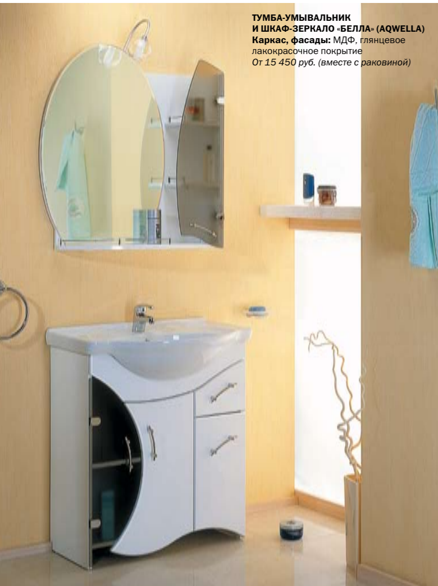
ТУМБА-УМЫВАЛЬНИК И ШКАФ-ЗЕРКАЛО «БЕЛЛА» (AQWELLA) Каркас, фасады: МДФ, глянцевое лакокрасочное покрытие От 15 450 руб. (вместе с раковиной)

Дополнительное разнообразие в модельный ряд «мойдодыров» вносит наличие или отсутствие опоры – ножек или цоколя. Конечно, сохранить в целости и сохранности мебель, которая подвешена к стене или опирается на пол металлически-