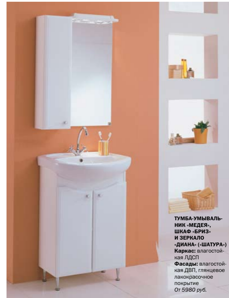
ТУМБА-УМЫВАЛЬНИК «МЕДЕЯ», ШКАФ «БРИЗ» И ЗЕРКАЛО «ИАНА» («ШАТУРА») Каркас: влагостойкая ЛДСП Фасады: влагостойкая ДВП, глянцево-лакокрасочное покрытие От 5980 руб.

НА ВКУС И ЦВЕТ Найти цветную, а не белую мебель для ванной комнаты ещё пару лет назад было практически невозможно. Однако сейчас даже отечественные производители позволяют себе колористические эксперименты. Правда, белизна и нежные пастельные оттенки по-прежнему преобладают. Дело в том, что эти цвета универсальны. Большинство же из нас покупает мебель уже после завершения отделки. Кроме того, и белый, и голубой цвет ассоциируются с чистотой. И многим кажется, что в ванной комнате должна находиться именно такая, «чистая» мебель.