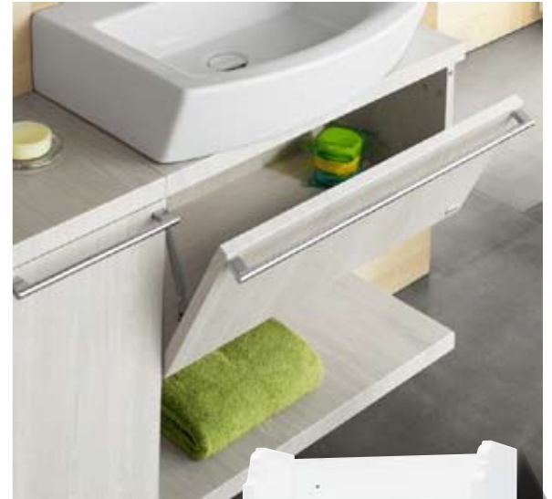
Δ ФРАГМЕНТ МОДУЛЬНОЙ СИСТЕМЫ HALL (ROCA) Каркас, фасады: влагостойкая ДСП, шпон От 27 000 руб.

Обычно из ДСП с ламинированным (чаще) и шпонируемым (реже) покрытием делают только мебельный каркас. От проникновения влаги и последующего разбухания его торцы защищают посредством специальной ABS-или ПВХ-кромки, «посаженной» на клей-расплав. МДФ используют для производства фасадных элементов, поскольку простота обработки материала позволяет придавать им интересную форму. Влагостойкость фасадов обеспечивают несколько слоёв грунта и слой глянцево-эмали. Тем не менее в продаже можно найти изделия, и каркас, и фасады которых выполнены только из МДФ. Производители подобной мебели мотивируют выбор следующим. На фасадах влага конденсируется в меньшей степени, чем на стенках. Следовательно, лучше, если каркас тоже будет выпол-