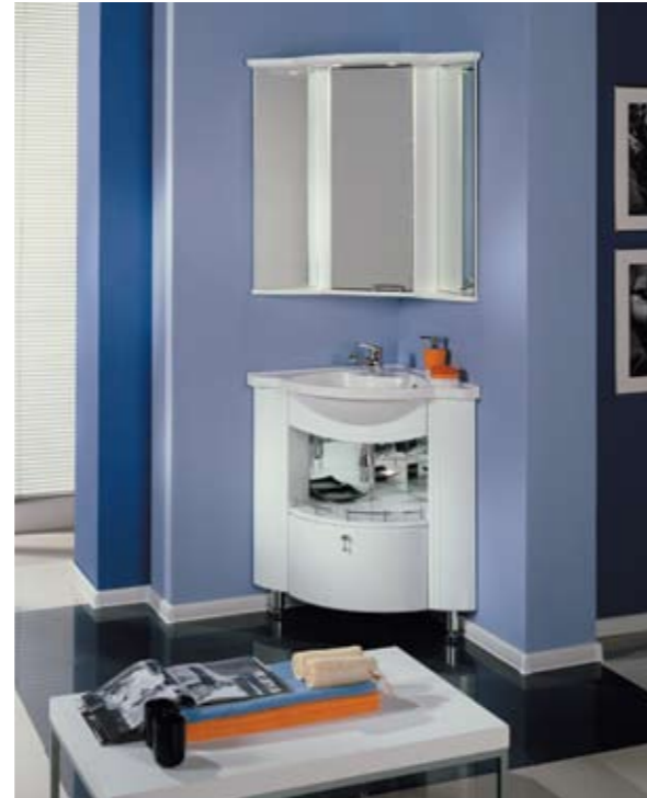
Δ УГЛОВЫЕ ТУМБА-УМЫВАЛЬНИК «КОНСУЛ» И ШКАФ-ЗЕРКАЛО «АЛЬТАИР-62» («АКВАТОН») Каркас: влагостойкая ДСП, глянцево-лакокрасочное покрытие Фасады: МДФ, глянцево-лакокрасочное покрытие От 19 900 руб. (вместе с раковиной)

большое помещение с повышенной влажностью. Массив без специального лакового покрытия в подобных условиях долго не прослужит. От влажности дерево разбухнет и потеряет привлекательный вид. Безремонтный срок эксплуатации металлической – штампованной или кованой – мебели больше. И всё же совсем отменить коррозию металла (появление ржавчины) никто не в силах. Работы